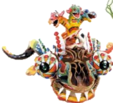
Una máscara de Diablada