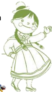
Una Cholita Boliviana